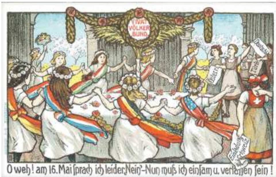
A genfi Népszövetség allegorikus ábrázolása

A saint-germaini békeszerződés területi rendelkezéseit, valamint az Ausztria Németországhoz való csatlakozásának tilalmát felülbírálni kívánó tirol és salzburgi tartományi népszavazásokon 1921 áprilisában-májusában a lakosság 99%-a Németország mellett voksolt. Az osztrák kormány nemzetközi nyomásra kénytelen volt leállítani ezt a belső kezdeményezést. A magyar határok megállapításakor a szomszédos államok között tiltakoztak az Apponyi Albert vezette magyar békeküldöttség által szorgalmazott népszavazásos megoldás ellen. Így a trianoni államhatárokkal kapcsolatosan népszavazásra, a békekonferencián kívül, a velencei jegyzőkönyv alapján végrehajtott 1921. december 14–16-i soproni plebiszcium kivételével – még az oltan esetekben sem került sor, amikor a határ-megállapítás során felmerült viták azt indokolták tették volna.