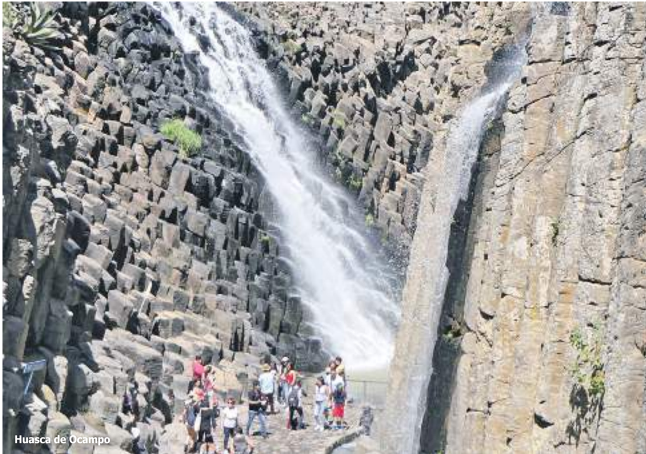
Huasca de Ocampo

Az egész napos szervezés és performanszok után, autóval hazafelé jövet egy újabb biztosítóval és Mexikó egészen bizarr ügyintézésével, valamint nagy valószínűséggel egy kisebb maffia csoportjával ismerkedtem meg, sajnos túlságosan közelről. Úgy tűnik, hogy szándékosan okoztak nekünk balesetet, az autónk eleje összetört. Végül a kaland happyenddel végződött, bár egy időre autó nélkül maradtunk. Itt most említést kell tennem a bűnözésről is. Mexikó különböző államaiiban más-más mértékű ugyan, de nagyon magas az erőszakos bűncselekmények száma. Mexikó hírhedt az ún. macsó kultúrájáról. A legkiemelkedőbb és persze leg-